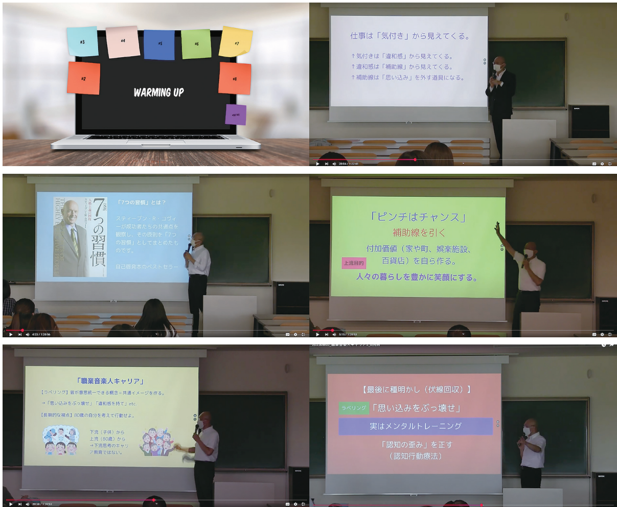
図3 「2回目以降の授業の提示教材と授業風景」

後半で使用している『16歳からのライフ・シフト』は、2023年8月22日初版の高校生向けに書かれた230ページのB5判の単行本である。2022年度と2023年度は『LIFE SHIFT 100年時代の人生戦略』の日本人設定に置き換えた『超訳ライフ・シフト：100年時代の人生戦略』を使用していたが、2024年より変更した。東洋経済新報社のウェブサイトはこのシリーズのマップ 6 が掲載されているが、事実上の後継版にあたる。図4に示す。「全国の中学・高校「総合的な探究の時間」「家庭科」、大学・専門学校のキャリア教育のテキストとしてお使いいただけます。」 7 と書いてあるとおり、『超訳ライフ・シフト：100年時代の人生戦略』よりかなり要約かつ整理されている。監修の「宮田純也・未来の先生フォーラム」のおかげであることは間違いない。文中に細かく薄い緑色で「まとめ」が記載されており、章末ごとに「問い」も設定されている。何人かの受講生はこの「問い」に対しての自らの感想なり回答をノートに書いて提出してくれていた。読書習慣のあまりない大学生であっても、この「まとめ」があることの意味は大きく、内容理解の手がかりにはなる。教科書選定の難しさを感じていたところであったので、『16歳からのライフ・シフト』の発行は福音であった。