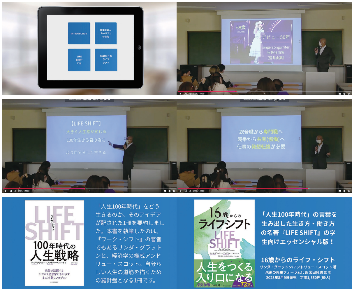
図2 「初回授業の提示教材と授業風景」

代になった。「より自分らしく生きる」ためにはどうすれば良いのか、何を大切にしていけばいいのか、そのためにも大きく人生観が変わることを受け入れていく準備が必要であり、「80歳の自分を考えること」を手がかりとし、そのきっかけを自ら探っていく授業であることを伝えた。