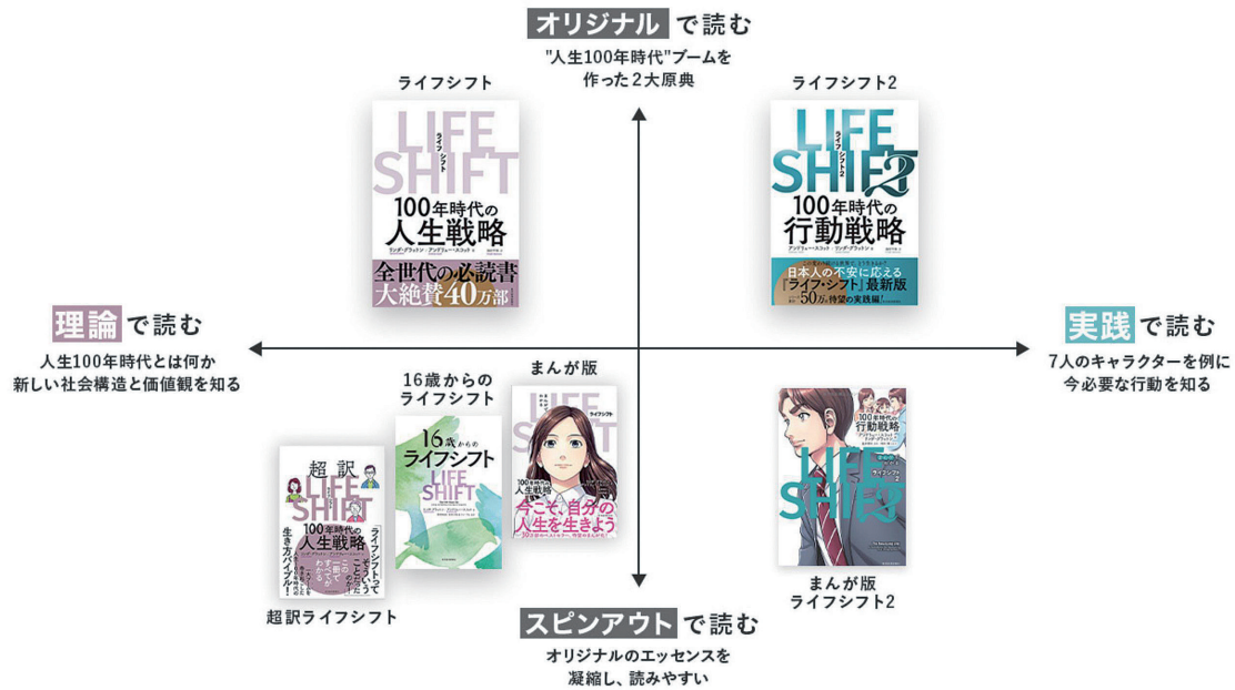
図4 「ライフ・シフトシリーズ」